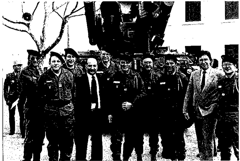
Maurice Roux-Mayoud avec une partie de son état-major en visite au 1 er Régiment Etranger de Cavalerie à Orange en mai 1980.

Le deuxième temps fort date de début septembre 1981 avec l'ascension du Mont-Blanc par Maurice et dix cadres du régiment qui avaient tenu à planter leur drapeau sur le toit de l'Europe. Le montagnard rejoignait ainsi le militaire, conciliant la passion et la conviction.