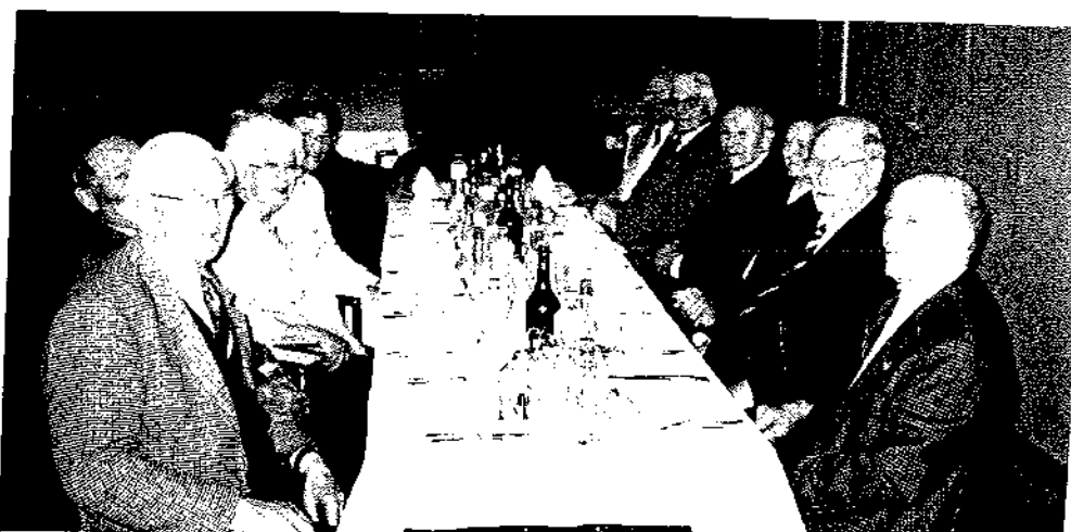
La table des anciens.