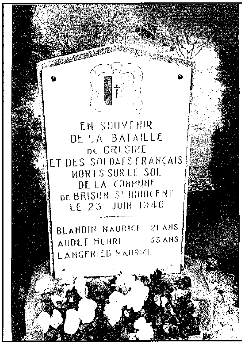
Les trois soldats sont probablement du 99 e RIA. Voir page 131 du livre.