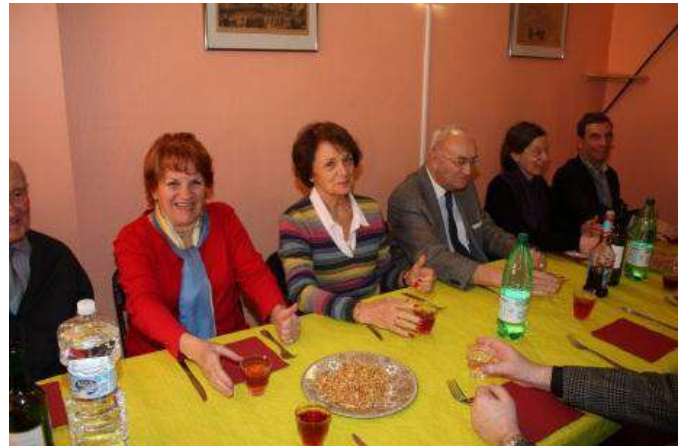
Phase 3 La main au godet (suite) - Dépêchons, dépêchons, nous avons soif !