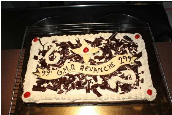
Le dessert, un Forêt noire en l'honneur du GMO Revanche