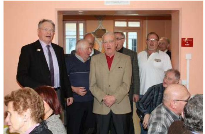
Le refrain du 9-9