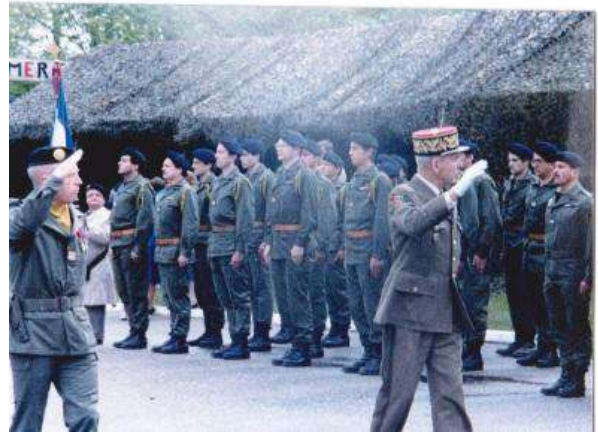
1984 Portes ouvertes avec le colonel Delabit