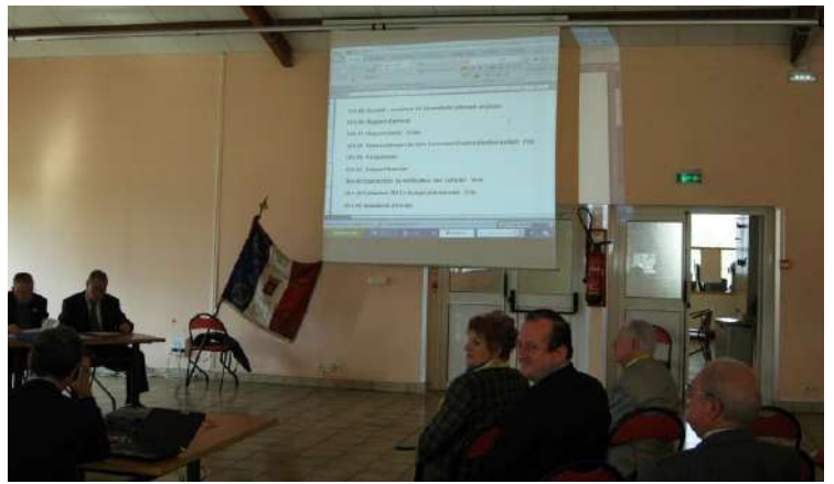
Présentation du programme de l'AG