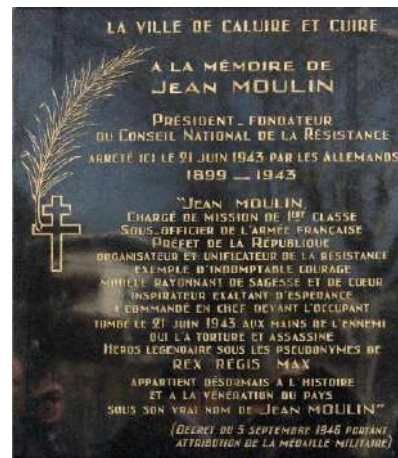
La plaque commémorative de la ville de Caluire