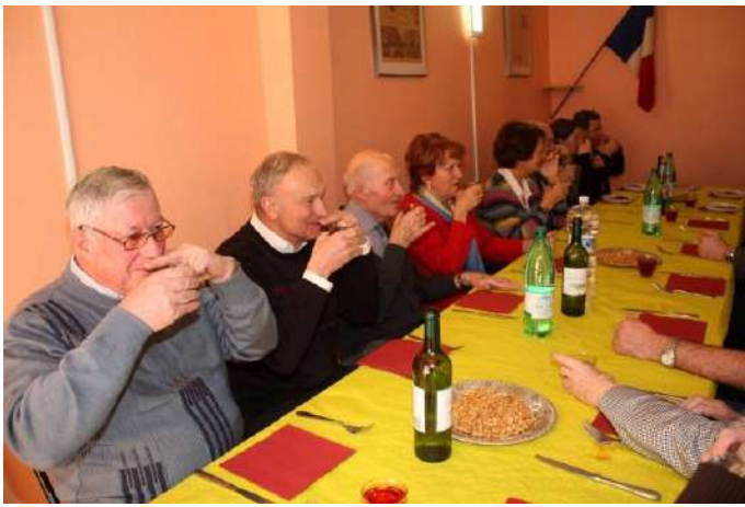
Phase 4 A deux doigts des écoutilles - et du paradis ...