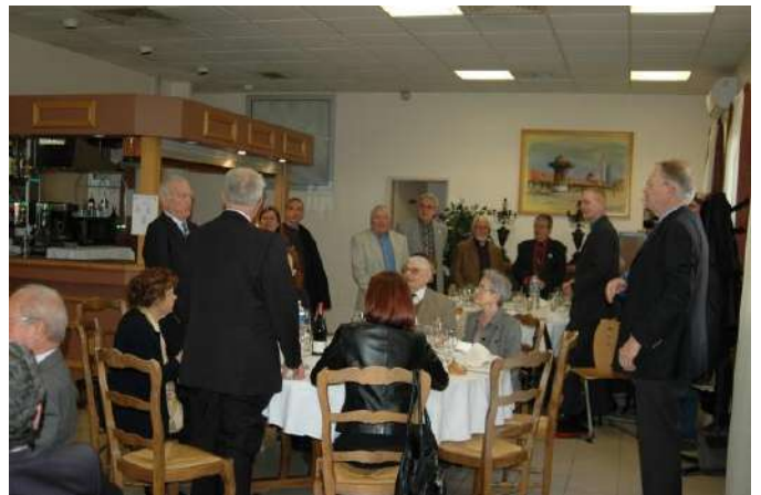
Le refrain du 9-9