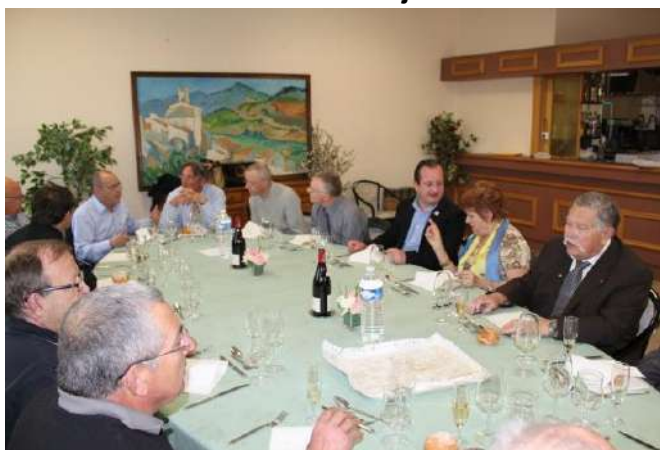
Belle table !