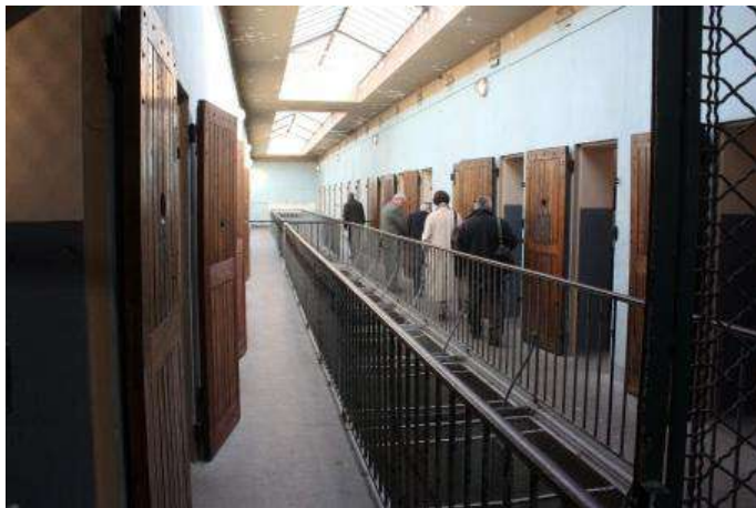
Cellules du 1er étage suite