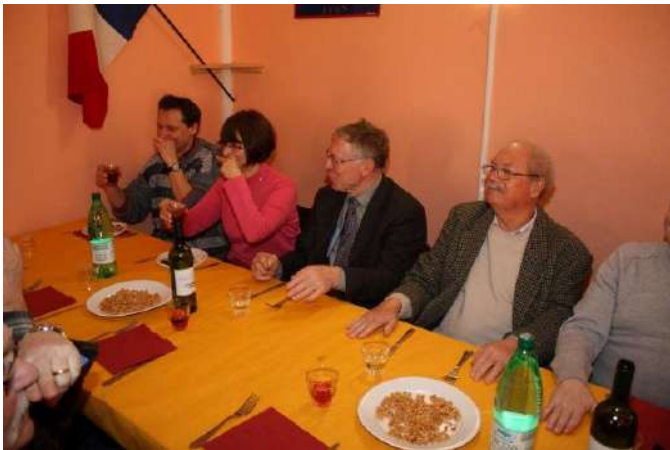
Phase 1 Repos - Cela manque de discipline