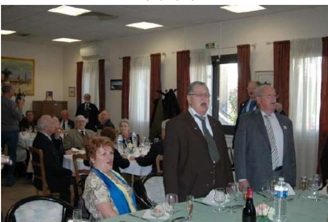
Le refrain du 299