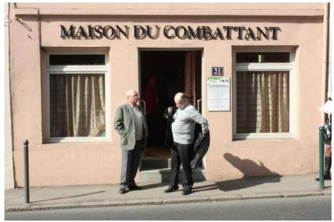
Notre restaurant d'un jour