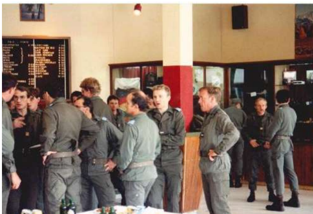
1990 Au foyer du soldat après un briefing