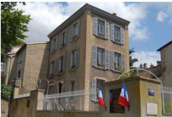
La maison du docteur Dugoujon –