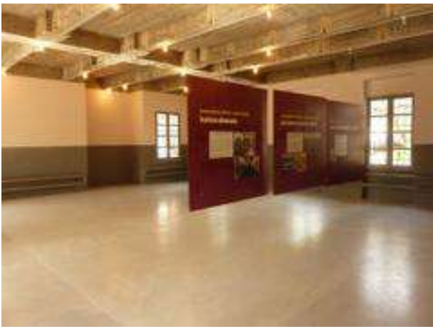
Le réfectoire transformé en salle de présentation de la prison