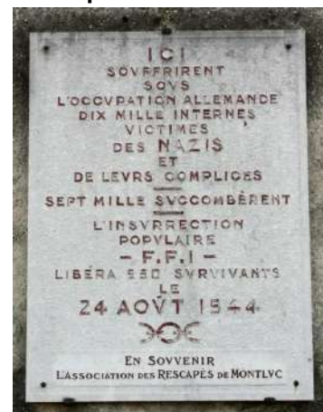
Plaque à l'entrée de la prison Montluc