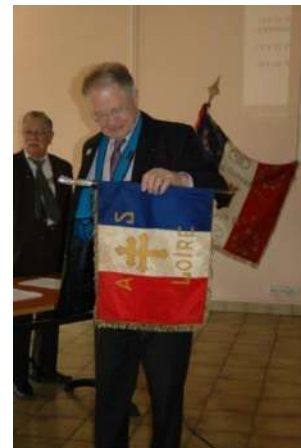
Le fanion appartient désormais à l'Amicale