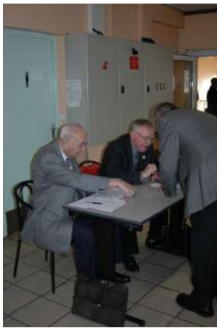
Pointage à l'entrée par le trésorier et le secrétaire