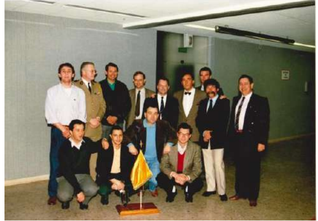
1989 3e compagnie du 299e RI