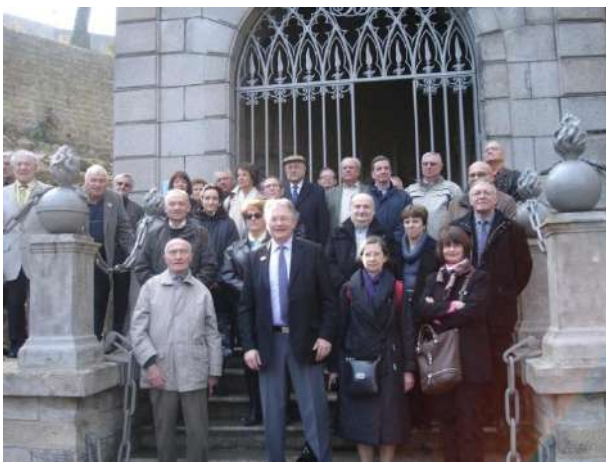
Le groupe devant le tombeau du maréchal Castellane