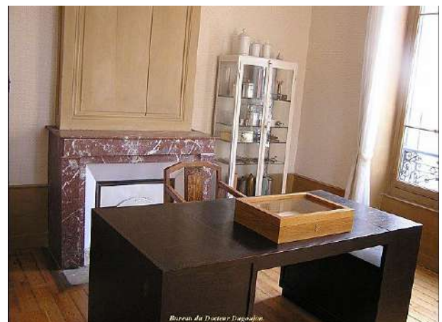
Le bureau du docteur Dugoujon