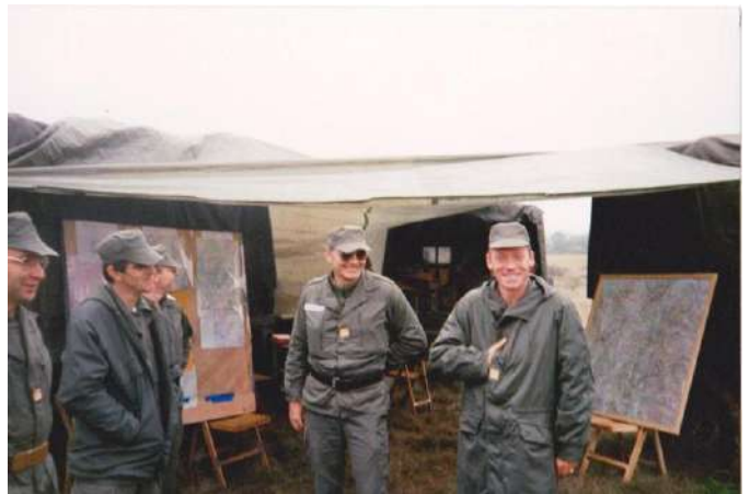
1989 PC du 299e RI en manoeuvre