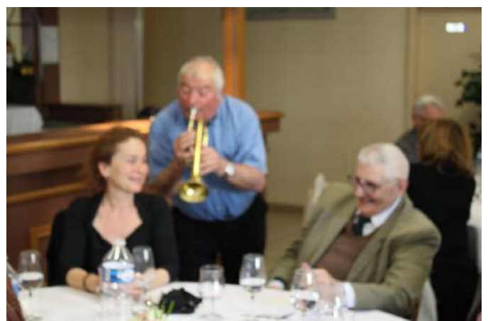
Flou artistique et trompette ...