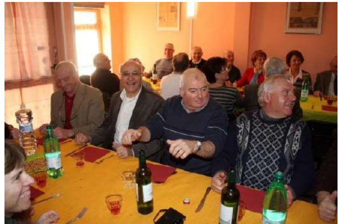
Phase 2 Le garde-à-vous - Peut mieux faire !