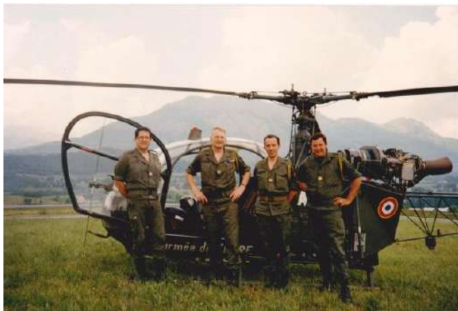
1989 Liaison de commandement à Gap