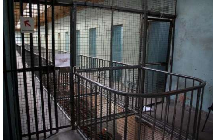
Cellules du 1er étage