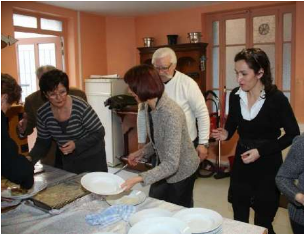
Phase 5 L'abus d'alcool étant dangereux, la dégustation du godet a été censurée au profit d'une séquence cuisine ...