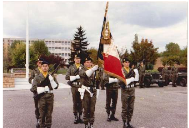
1992 Garde au drapeau du 299e RI