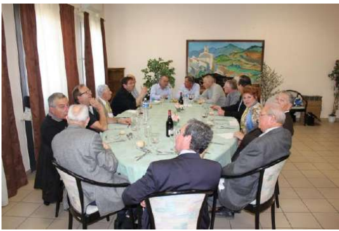
La même au complet