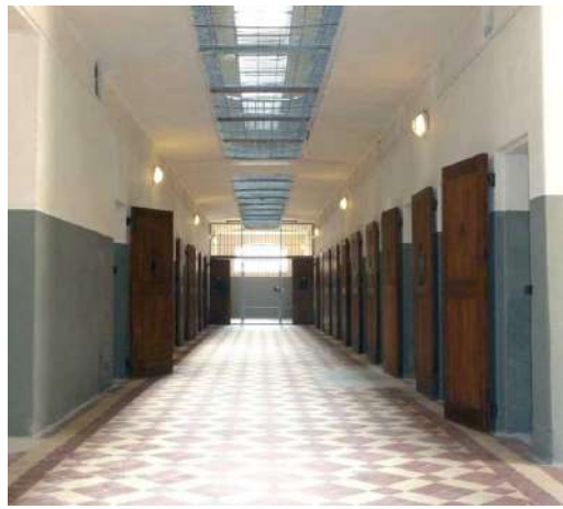
Couloir des cellules du rdc