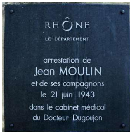
La plaque du Conseil général du Rhône