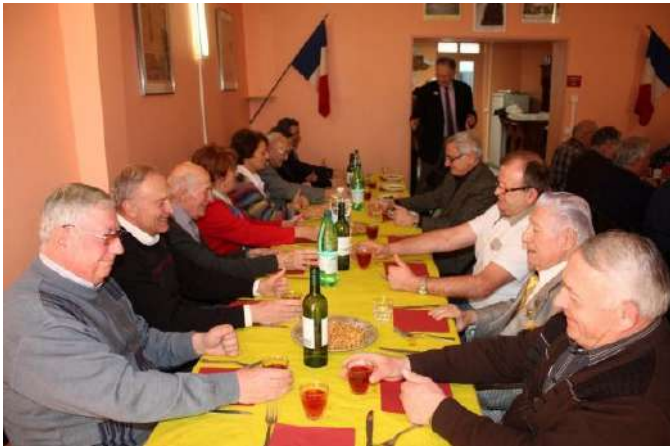
Phase 3 La main au godet - Belle cohésion