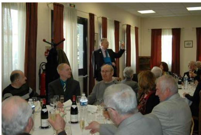
Verre de l'amitié