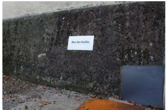
L'emplacement du mur des fusillés