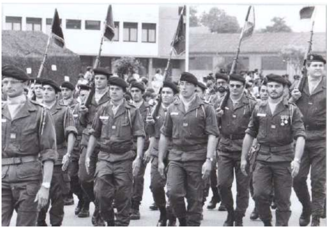
Défilé du 299e RI - quelle année ?"