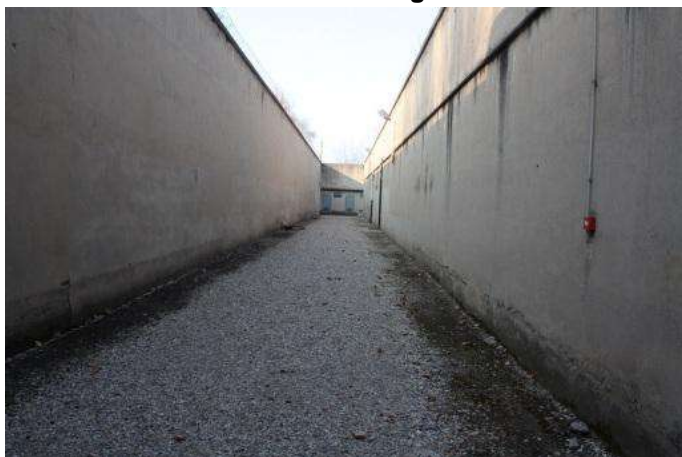
Le couloir de la mort vu depuis le mur des fusillés