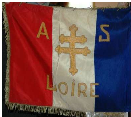
Le fanion côté AS Loire