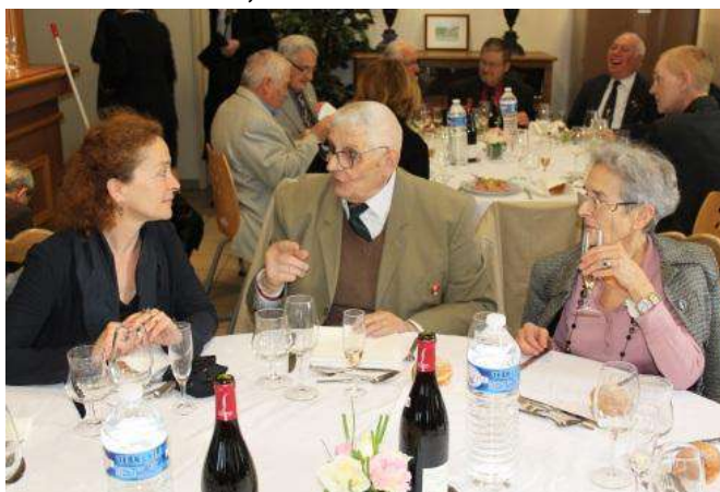
Les héros du jour