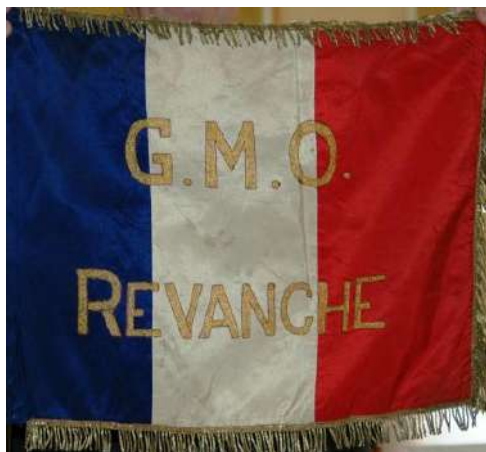
Le fanion côté GMO Revanche