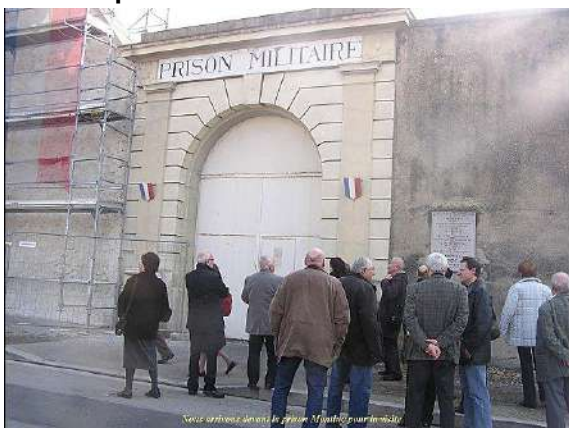
Le groupe devant la porte de la prison Montluc