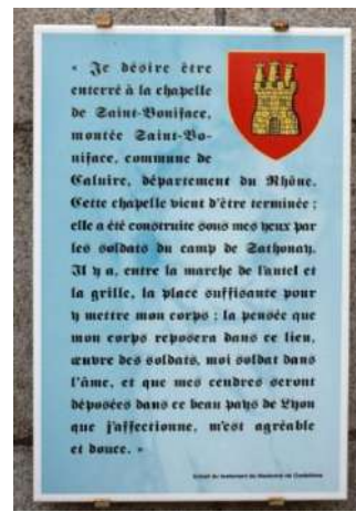
Le testament du maréchal de Castellane