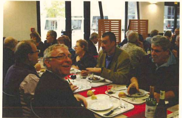
Ca va mieux