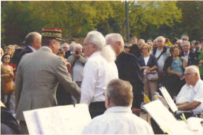
Félicitations aux deux chefs