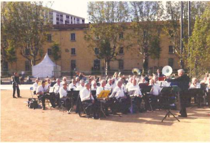
La musique à sergent Blandan 51 ans après !