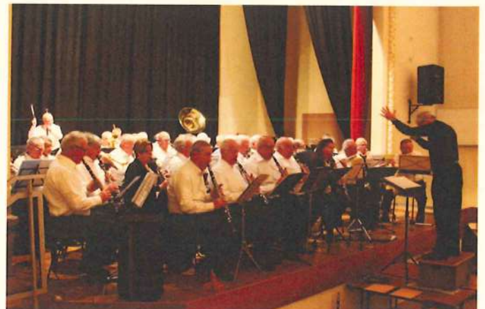
L'orchestre en action