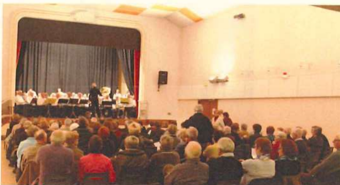
Le concert à la salle des fêtes