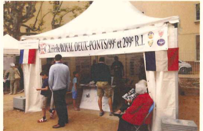
Le stand commun Amicale Musée