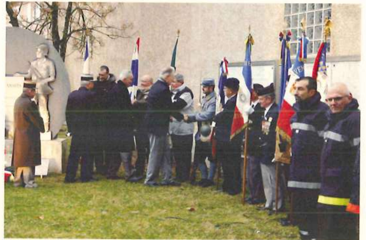
Le salut aux porte-drapeaux