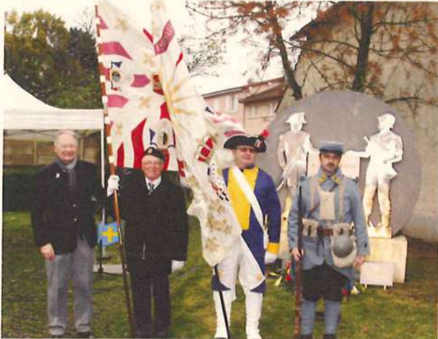
Emblèmes et monument