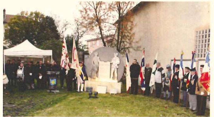
Vue partielle 1