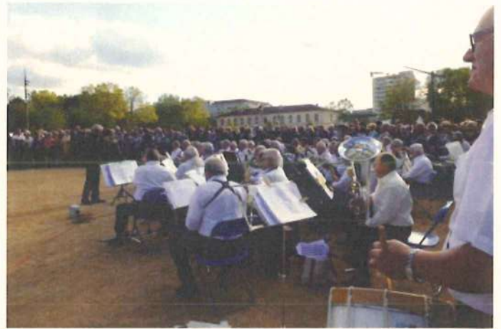
Le public est là !