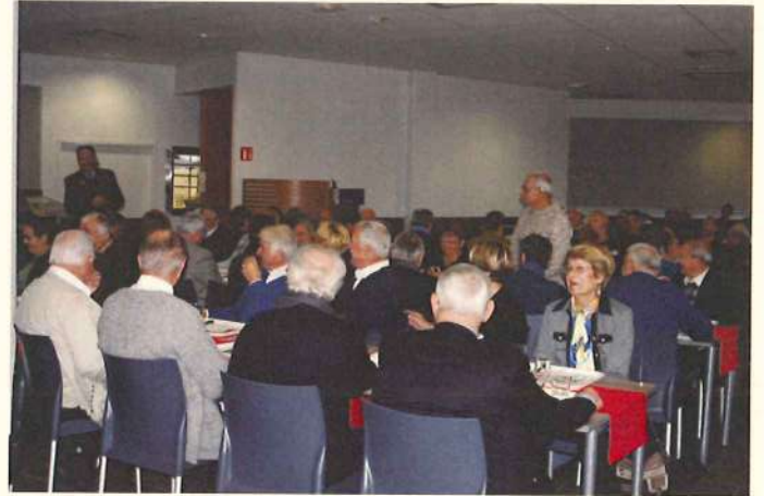
On a faim !