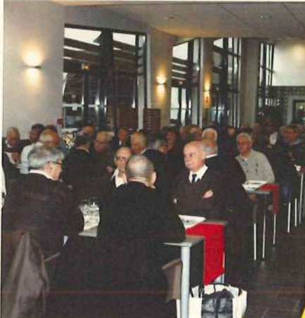
On attend !