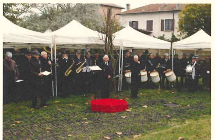
La musique et les deux chefs