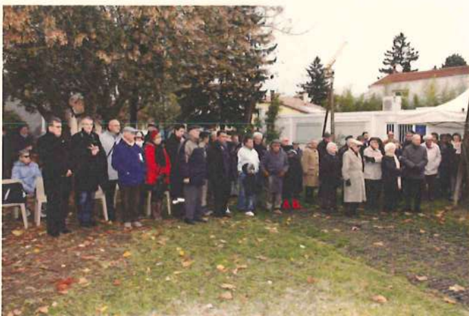
Vue partielle 2