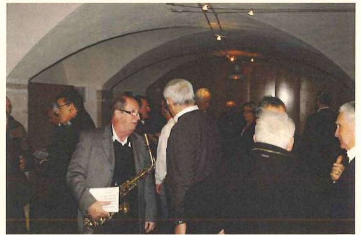
La salle de répétition des musiciens